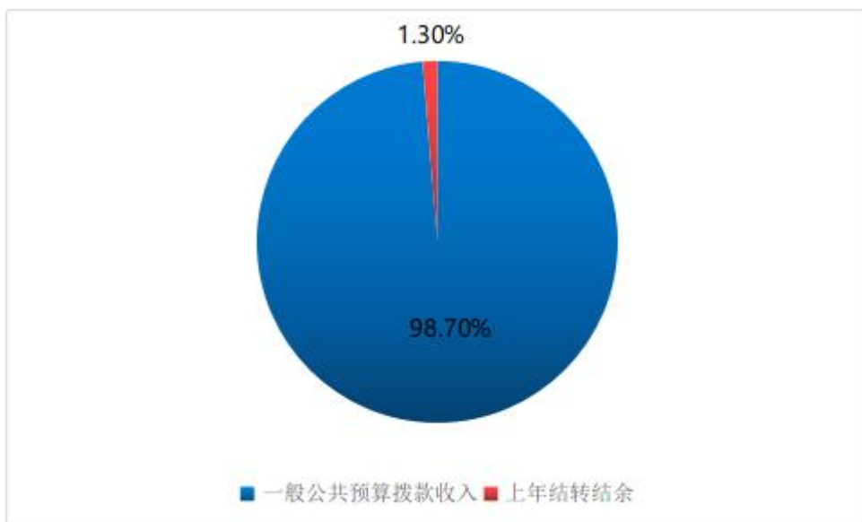
图 1: 收入预算