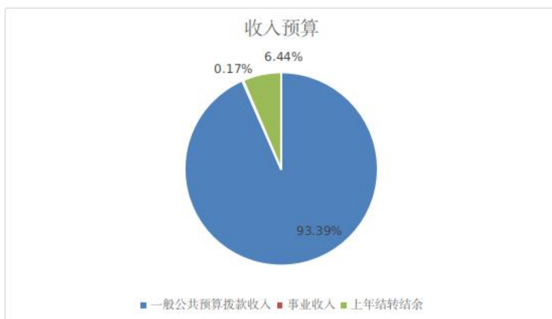
图 1: 收入预算